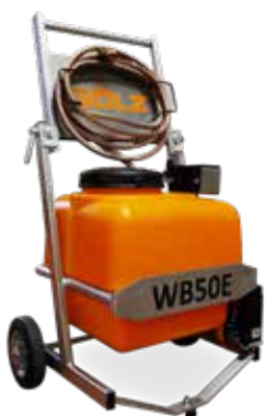
WB50E, 50L Wassertank