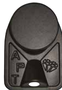
APT Staub- und Wassersammelring