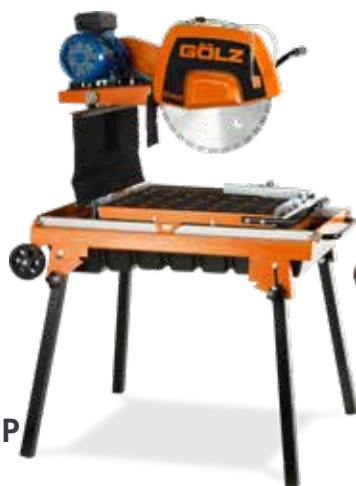
BS400E / P

Benzin / Elektro Schnittlänge 650 mm Blatt Ø 400 mm