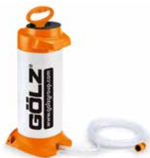
WB 10 L Druckwasserbehälter